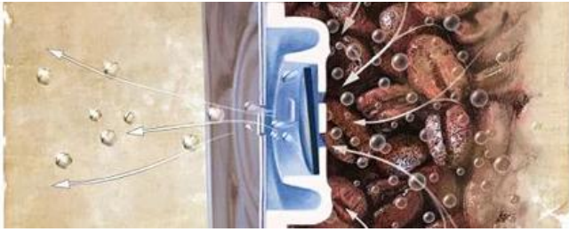
وضع فتح / الإصدار

عندما يزداد الضغط داخل عبوة محكمة الغلق إلى ما وراء ضغط فتح الصمام ، يتم فتح قرص مطاطي في الصمام مؤقتًا للسماح للغاز بالهروب خارج الحزمة. كما يتم تحرير الغاز والضغط داخل الحزمة يسقط تحت الضغط إغلاق صمام ، يغلق الصمام.