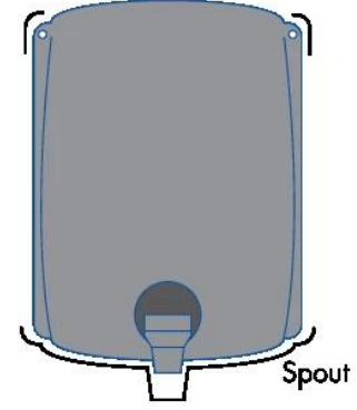
Adding additional string tie