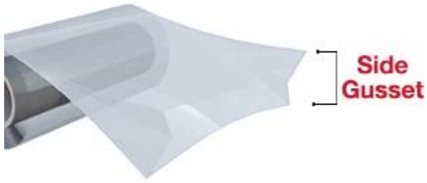
Gusseted Bag or Tubing

الغسيت هو قطعة من مادة قوية تتصلب عند التجميد وتستخدم لتقوية الحواف والركائز في الأكياس والأنابيب. يتم تصنيعه من مواد مثل البولي إيثيلين أو البولي بروبيلين. الغسيت يوزن عادةً بـ 100 جرام لكل متر مربع. يتم استخدامه في صناعة الأكياس والأنابيب التي تحتاج إلى تقوية إضافية.