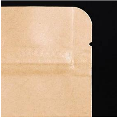
U-Typ leicht zu zerreißen