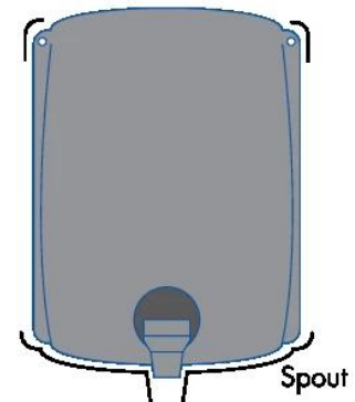
Adding additional string tie