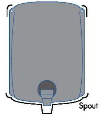
Adding additional string tie