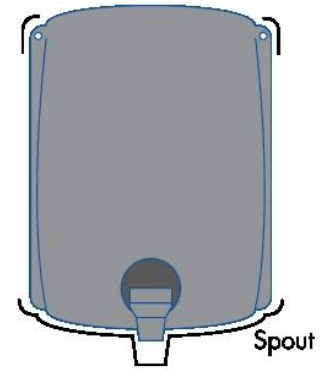
Adding additional string tie