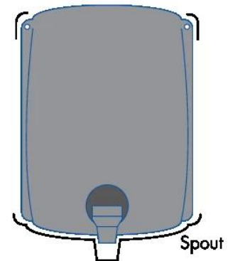
Adding additional string tie