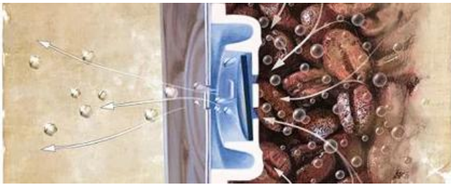
Modo de apertura / liberación

Cuando la presión dentro de un paquete sellado aumenta más allá de la presión de apertura de la válvula, un disco de goma en la válvula se abre momentáneamente para permitir que el gas se escape fuera del paquete. A medida que se libera gas y la presión dentro del paquete cae por debajo de la presión de cierre de la válvula, la válvula se cierra.