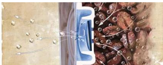
Modo de apertura / liberación

fuera del paquete. A medida que se libera gas y la presión dentro del paquete cae por debajo de la presión de cierre de la válvula, la válvula se cierra.