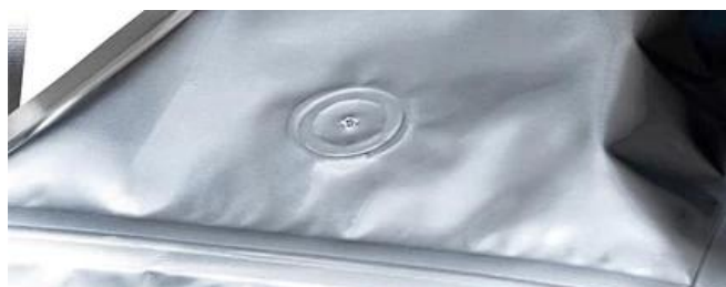
Posizione chiusa a tenuta d'aria

Quando la pressione all'interno di una confezione sigillata aumenta oltre la pressione di apertura della valvola, la tenuta tra il disco di gomma e il corpo della valvola viene momentaneamente interrotta e la pressione può fuoriuscire dalla confezione.