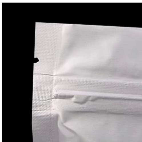
Tipo U facile da strappare