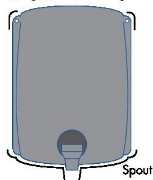
Adding additional string tie