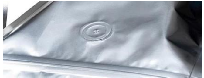
Posizione chiusa a tenuta d'aria

Quando la pressione all'interno di una confezione sigillata aumenta oltre la pressione di apertura della valvola, la tenuta tra il disco di gomma e il corpo della valvola viene momentaneamente interrotta e la pressione può fuoriuscire dalla confezione.