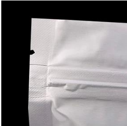
Jenis U mudah rosak