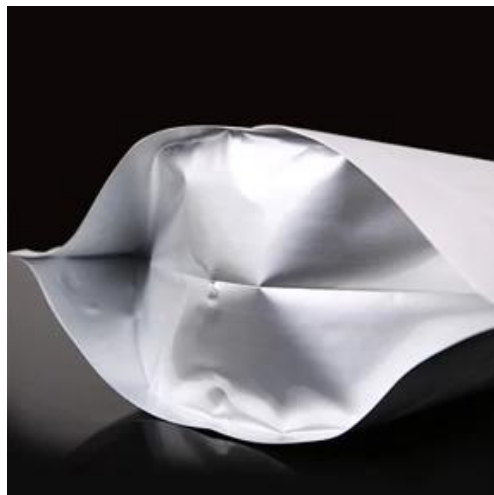
Bahagian bawah tebal