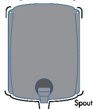
Adding additional string tie