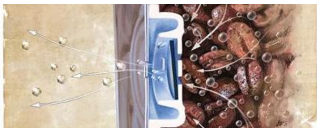
Режим открытия / выпуска

Когда давление внутри герметичной упаковки превышает давление открытия клапана, на мгновение открывается резиновый диск в клапане, позволяя газу выйти из упаковки. Когда газ выпускается, и давление внутри упаковки падает ниже давления закрытия клапана, клапан закрывается.